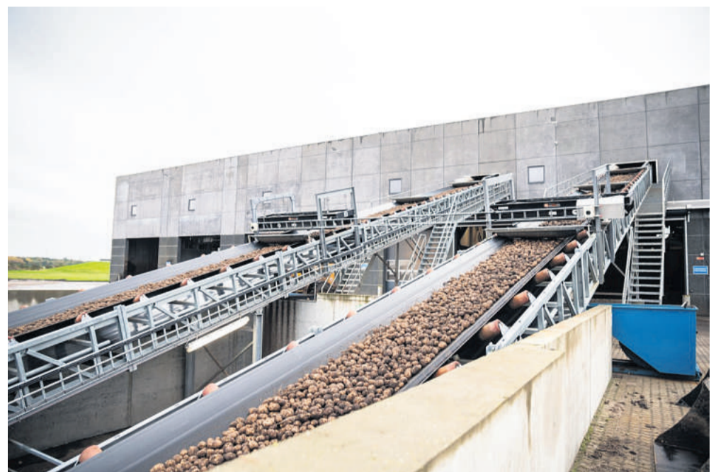
Karup Kartoffelmelfabrik bruger masser af el i den energitunge produktion. Men en ny stor solcellepark kan gøre fabrikken selvforsynende med grøn strøm.

folk, der bor inden for 3,5 kilometer fra anlægget at købe andele. De udbydes til 5000 kroner per styk, og hver enkelt vil kunne erhverve 50. I anden omgang vil borgere fra resten af Viborg Kommune blive tilbudt at købe.