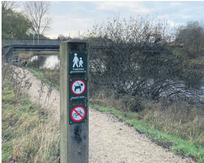
Trækstien langs Gudenåen er populær både for vandrere og for folk, som bruger stien til den daglige gåtur. Arkivfoto

I perioder hvor vandet står højt, kan Trækstien være oversvømmet. Derfor planlægges der nu træstier, så folk kan gå tørskoet uden at træde ind på private arealer. Arkivfoto: Hanne Bliksted